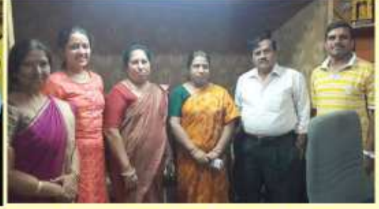
ಕನ್ನಡ ಪುಸ್ತಕ ಪ್ರಾಧಿಕಾರದ ಹೊಸ ಯೋಜನೆ "ಕಥಾಗಮಕ-ಕಥಾಗುಚ್ಚ"ದ ಶುಭಾರಂಭ