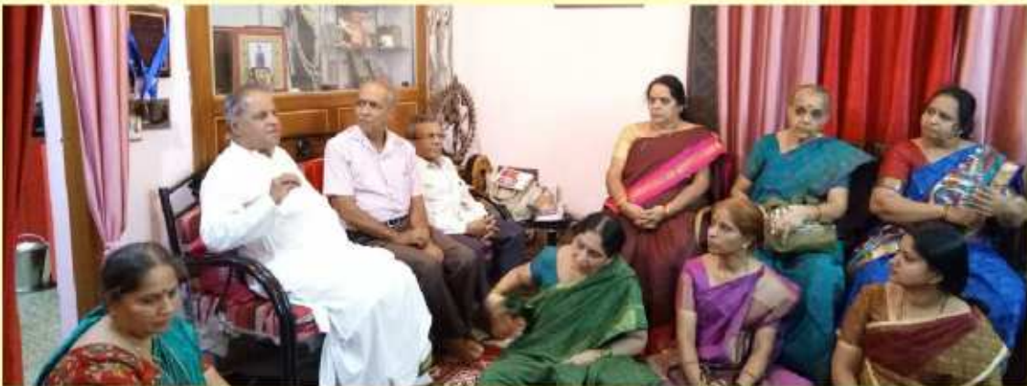
ಮೈಸೂರಿನ 'ಪರಿಶ್ರಮ ನಿವಾಸ'ದಲ್ಲಿ ನೆರವೇರಿದ ಅಧಿಕ ಜ್ಯೇಷ್ಠ ಮಾಸದ 'ಗಮಕ ಗಾಯನ ಗೋಷ್ಠಿ'